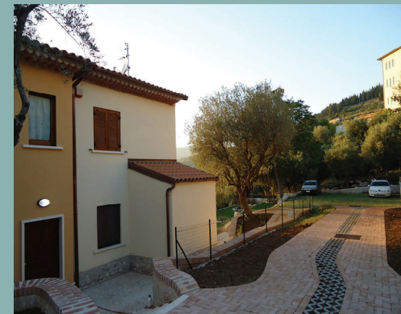
Villa degli Ulivi

La struttura è dotata di parcheggio privato ed ampio giardino terrazzato con vista sul Vallo di Diano.